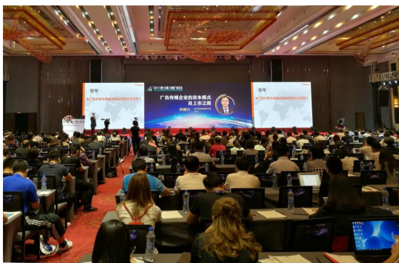
2017（第十三届）中国广告论坛聚集众多行业精英与专业人士，极具影响力